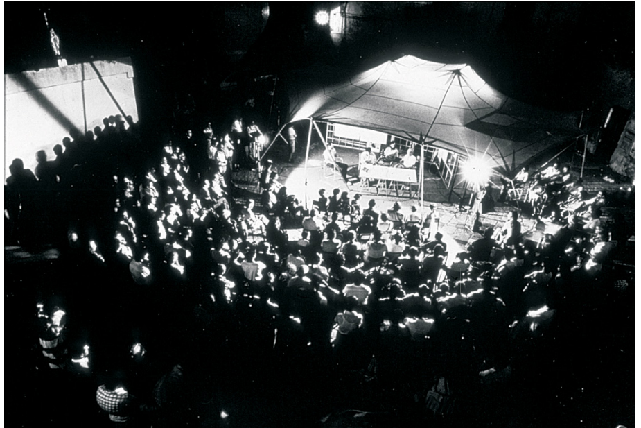
Neighborhood Workshop, UNESCO reconstruction experiment, Otranto 1979

The assignment of the studio is to identify and design urban and architectural interventions that can accelerate creation of (un)productive commons in the neighbourhood.