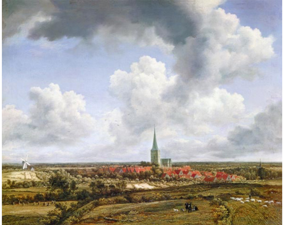
Afbeelding: Zicht op Ootmarsum - Jacob van Ruisdael

Studio 'Moving East' verkent nieuwe groeiscenario's en perspectieven voor oosterse kernen en streken. Bestaande kwaliteiten inzichtelijk maken en daarop voortbouwen.